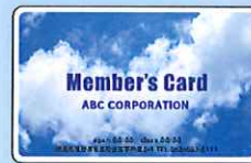
当社昇華型プリンタでの印刷