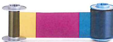
再転写用カラーリボン