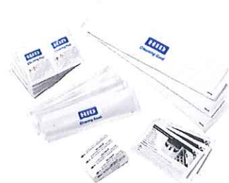
クリーニングキット 88933