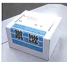
IDカードつやあり(白無地)